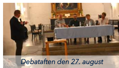
Debataften den 27. august

Udover dette gennemførte vi orienteringsmøde den 14. maj, hvor vi glade kunne skrive flere på listen over interesserede i Menighedsrådsarbejdet, og et debatmøde i kirken den 27. august, hvor et meget aktivt panel kastede sig ud i refleksioner og deres bud på hvad Folkekirken vigtigste opgave er, hvilken rolle kirken har i forhold til trivsel, hvad menighedsrådet skal arbejde med og meget mere.