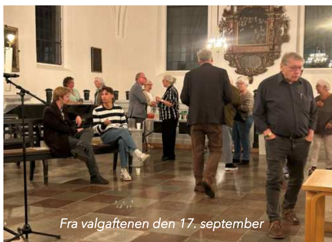
Fra valgaftenen den 17. september